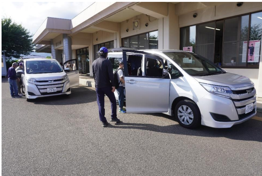
帰りの送迎車に乗車する利用者さんたち

あぶくま福祉会としてかねてから懸案となっていた利用者さんの個別送迎について、9月1日から、福島市・伊達・桑折町・国見町・保原方面を先行した形で開始しました。だての郷では、個別送迎用に新たにワゴン車を3台購入し、利用者さんの送迎にあたっています。3台とも福祉車両仕様で利用者さんの乗降が便利になっています。