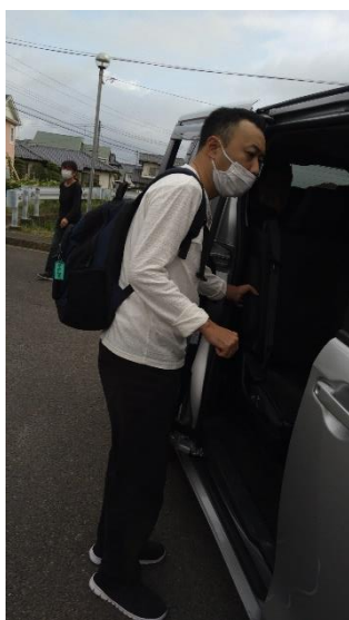
朝の送迎車に乗車する利用者さん