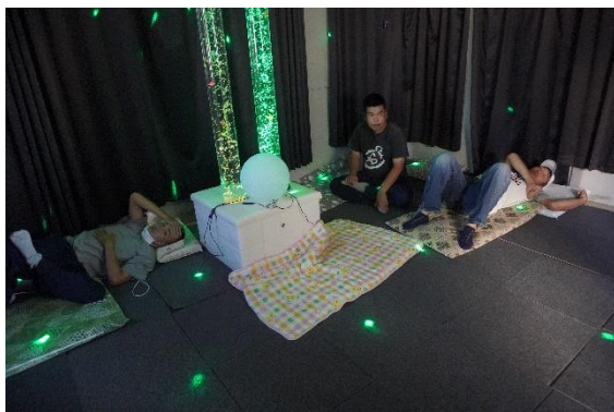
スヌーズレーンで過ごす利用者さんたち

だての郷旧分室、現在「ほっと」という愛称で利用しているスヌーズレーン室に、株式会社USENから3か月間無償で貸し出されたタブレット端末方式BGMが設置されています。好きな音楽を聴きながら、この部屋でリラックスすることができます。毎日、利用者さんたちが音楽を聞きながら、この部屋で気持ちをリラックスさせています。