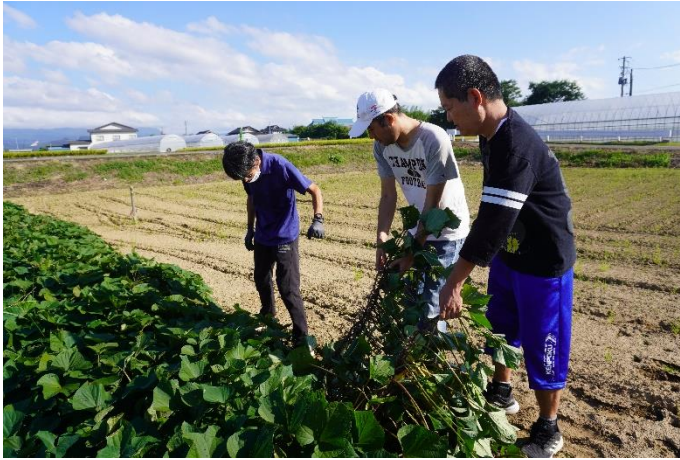
サツマイものつる上げを体験する利用者さん

9月21日午後、だての郷利用者代表によるさつまいものつる上げを行いました。今回初めての作業で全部はできませんでしたが、この週につる上げ作業を行う予定です。葉に太陽の光をあて栄養分がいもに届くようにするもので、利用者さんたちの代表が畑に行って作業を行いました。みんなつるをやさしくつまんで起こしてくれました。