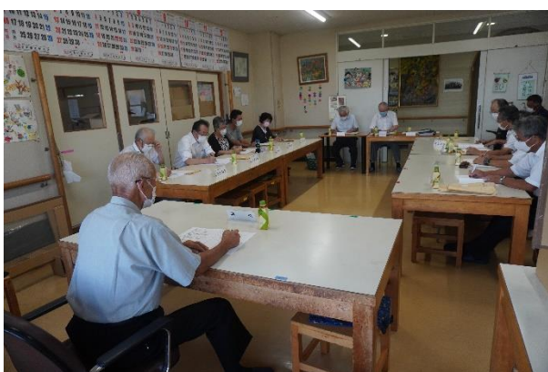
議事を審議する評議員の皆さん

令和3年8月19日、令和3年当法人第4回理事会がほどはら授産所で開催しました。理事長あいさつと議長選出のあと議事に入り、議案3件を審議いただきました。議案は、社会福祉充実計画事業における「大型ハウス設置及び既存ハウス移設事業」の契約締結。補正予算として「グループホーム老朽化建物の一部解体費用」の計上。第3回評議員会の開催日時、内容が審議され、意見、質問が交わされました。審議の結果、いずれの議案も原案のとおり可決されました。