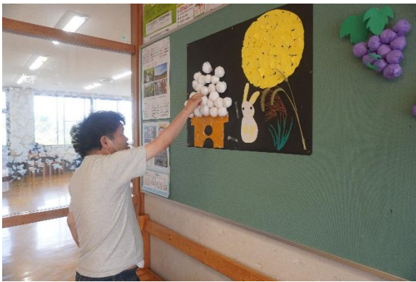
団子にふれる利用者さん