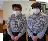
お料理を出していただいた raku-rakuのスタッフさん

県内の新型コロナ感染者数が下げ止まり傾向になり、社会全体としても安心感が漂い、3年振りに「外食体験会」を6月28日から3日間、7グループに分けて保原町のNPO法人ボネールが運営する障がい者就労支援B型事業所「raku-raku」で行いました。今回利用するにあたり、raku-rakuさんのご高配で、初日を除く2日間は貸し切りにしていただき、他のお客様に気兼ねすることなく、ゆったりした気持ちで食事をとることができました。