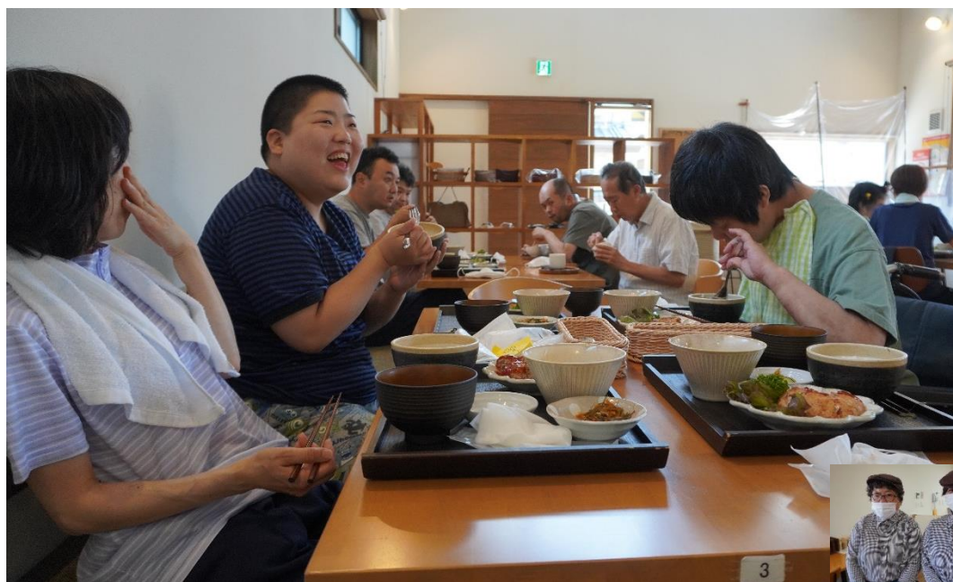
楽しそうにランチをいただく利用者さん