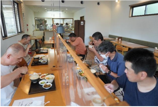
味わいながらランチをする利用者さんたち(写真上下)

今回3日間とも raku-raku お勧めのランチメニュー「煮込みお豆腐ハンバーグランチ」を、みんなでいただきました。食後にはデザートのアイスとコーヒーをいただき、店を出る前に、それぞれ自分の財布から食事代を支払う会計の体験もすることができ、有意義な外食体験会となりました。