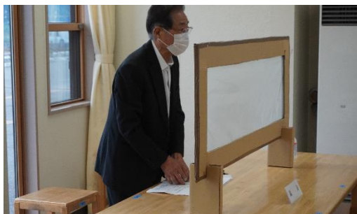
理事会の議長就任のごあいさつをする八幡理事