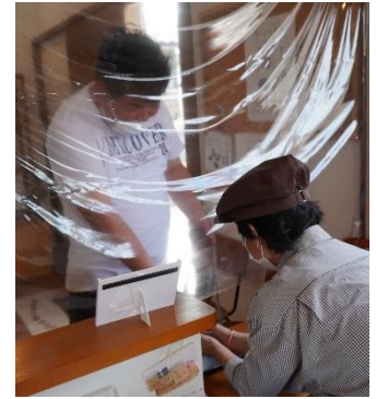
帰りのお支払い体験をする利用者さん