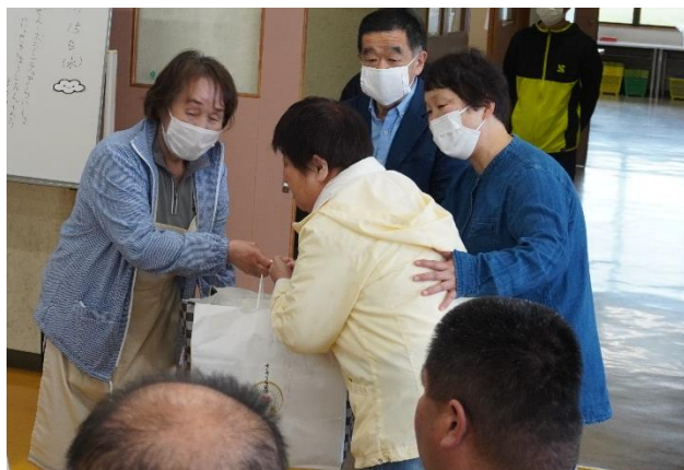
遠藤委員長（写真左）からタオルを受け取る利用者さん