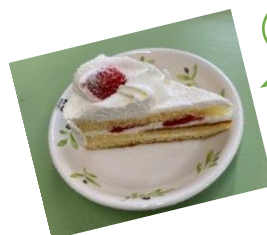
今月はショートケーキでした