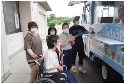
ジェラートの出来上りを待つ利用者さんたち