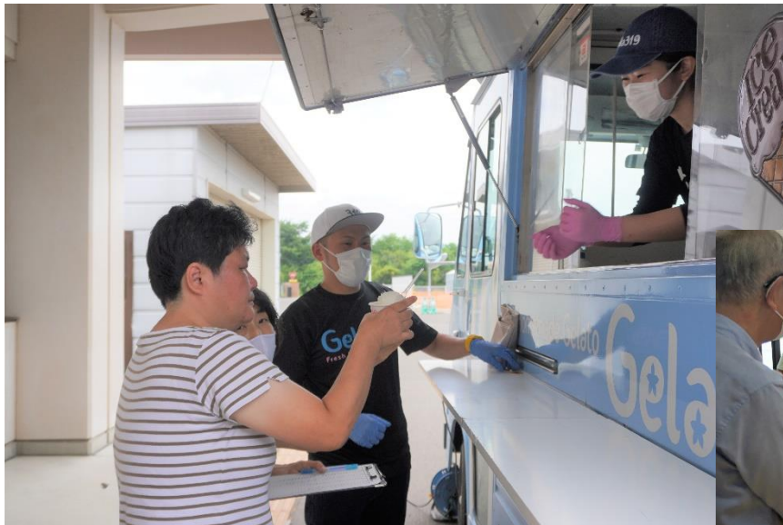
店員さんからジェラートを受け取る利用者さん