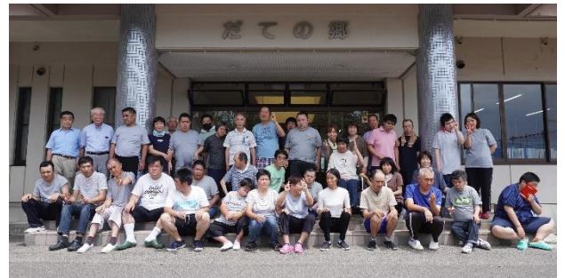
創立記念日を祝って集合写真を撮りました

利用者と保護者の皆様をはじめ、地域の皆様に支えられ、この日、33周年を迎えることができました。さらに地域の福祉向上を目指して4事業所が一丸となって、事業を進めていくことにしています。