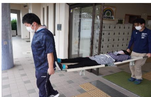
利用者さん（写真中央）がけが人に扮し搬送訓練も行いました

毎月1回、施設では避難訓練を行っています。6月の避難訓練では、厨房からの出火による火災避難と、利用者さんが避難中転倒しケガをして想定で、担架搬送訓練も行いました。ケガ人役の利用者さんは神妙な表情で運ばれていきました。その他の皆さんも真剣に訓練に参加し、有事に備えていました。