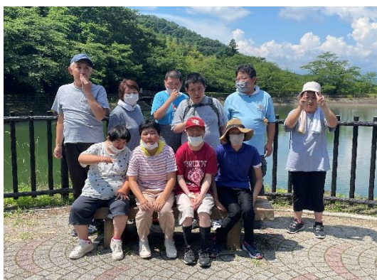
沼のほとりで記念写真