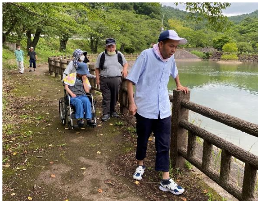
沼の周りの遊歩道を散策する利用者さんたち