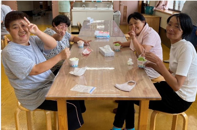
ジェラートをいただき大満足