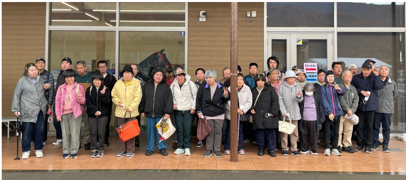
道の駅ふくしまの入口前で集合写真