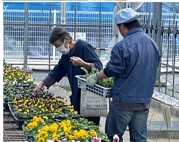
お客様のお手伝いをする利用者さん

11月10日から15日までの6日間にわたって秋のほとほら花市ウィークを開きました。今年も秋販売用の花の種まき後、夏の猛暑の影響を受けましたが、昨年の体験を踏まえ種のまき直しや温度管理等を行い、例年に比べて約1か月遅れの花市となりましたが、パンジー、ピオラ、つりがねそうの販売を行うことができました。期間中、多くの皆さんが花苗を求めて、色合いを考えながら、それぞれのお花をお買い求めいただきました。遠くは福島、白石市からも来ていただき、花苗購入の輪が広がってきています。