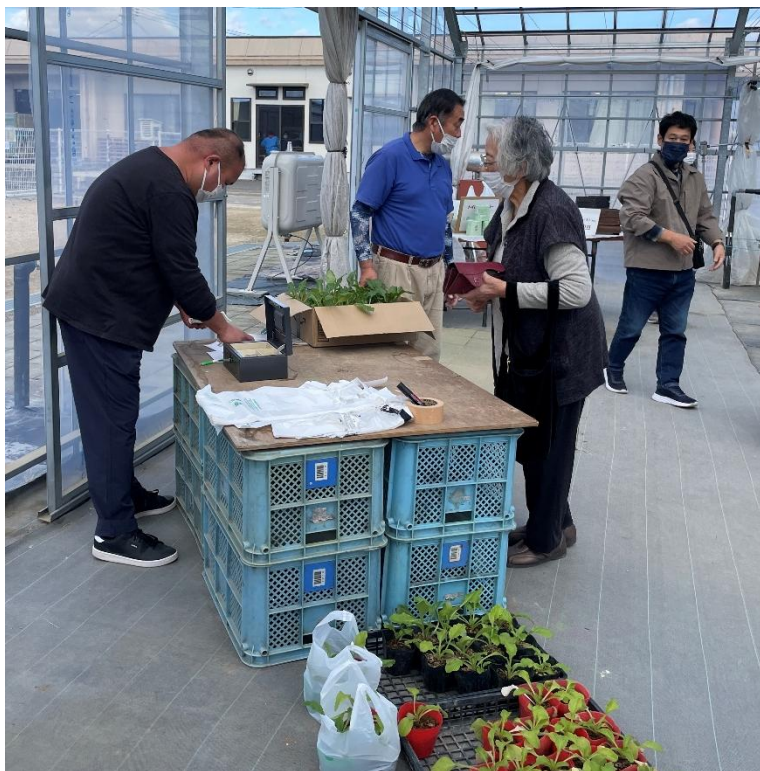
お会計をするお客様(写真右の2人)